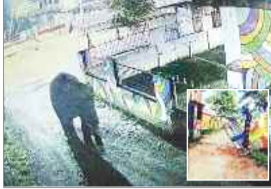
आत्मानंद स्कूल के बाहर घुमता हाथी, इनसेट में क्षतिग्रस्त गेट।

वन परिक्षेत्र प्रतापपुर में तीन हाथियों का दल लम्बे समय से भ्रमण कर रहा था। एक सप्ताह पूर्व हाथी छुई जंगल की ओर चले गए थे। लम्बे अंतराल के बाद हाथियों के अन्वेषण जाने से वनकर्मी राहत की सांस ले रहे थे कि बीती रात्रि 12 बजे ग्राम मायापुर के ग्रामीणों ने वनकर्मीयों को गांव में एक हाथी के पहुंचने एवं फसल तबाह करने की सूचना दी। ग्रामीणों ने दंतैल के आबादी क्षेत्र के निकट पहुंचने की भी सूचना दी। सूचना मिलते ही वनकर्मी हाथी मित्र दल के सदस्यों को लेकर पिकअप से ग्राम पंचायत मायापुर -1 पहुंचे। वनकर्मीयों ने तेज आवाज पर हूटर अजया तो हाथी अपना रास्ता बदलकर प्रतापपुर की ओर