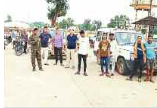
बाजार में मुनादी करते वनकर्मी।

हाथियों की मौजूदगी के मामले में वन परिक्षेत्र प्रतापपुर काफी संवेदनशील माना जाता है तथा पूरे क्षेत्र में अधिक मात्रा में गन्ना की खेती होने के कारण लगभग पूरे साल यहां हाथी मौजूद रहते हैं। कई बार हाथी अमनदोन जंगल से शहरी क्षेत्र में पहुंच जाते हैं। पांच वर्ष पूर्व 25 हाथियों का दल पक्की तालाब के पीछे स्थित कॉलेज मैदान तक पहुंच गया था। हाथियों को वन अमले ने सुरक्षित जंगल तक खदेड़ा था। इसके बाद रात में एक हाथी शहरी क्षेत्र में घूमते हुए सीसीटीवी में कैद हुआ था। वन अमले की सतर्कता से हाथियों ने कमी भी खास क्षति नहीं पहुंचाई।